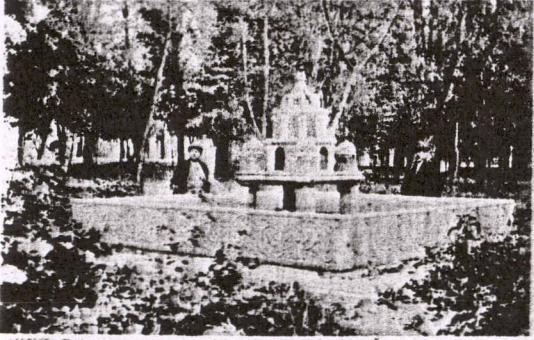
НШ, Водоскок у парку

Kuzeybatı Bulgaristan'daki toprak ağaları, merkezileşen yerel idare-