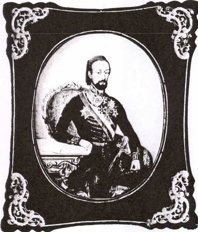
1860'ta Rumeli teftişine çıkan Sadrazam Kıbrıslı Mehmed Emin Paşa, (1813-1871). Muhtemelen Londra'da büyükelçilik yaparken kalotip tekniği ile alınmış görüntüsü, 1849.

19. yüzyılın çoketnisiteli imparatorlukları Avrupa'daki değişimleri yakalayabilmek için reformlar yapmış ve idarelerini merkezileştirmeye çalışmışlardır. İktisadi ve sosyal problemlerle karşılaşan Rusya, 1861'de serflığı kaldırmıştır. Osmanlı'da, Tanzimat döneminde yerel idareyle ilgili çözülmeye çalışılan önemli sorunlardan biri de, kuzeybatı Bulgaristan'daki çiftlik meselesidir. Arşiv belgelerinden, özellikle 1859 tarihli çiftlik layihalarından ve Sadrazam Kıbrıslı Mehmed Emin Paşa'nın 1860'ta çıktığı Rumeli teftişinin belgelerinden yararlanarak, yapılan düzenlemeleri Rusya'daki toprak reformuyla karşılaştırmalı olarak inceleyeceğim.