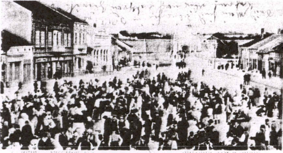
НШ, Сајамско тржиште

Niş'ten bir kartpostal, muhtemelen 20. yy başı: Vodoshok yerleşimi ve park.